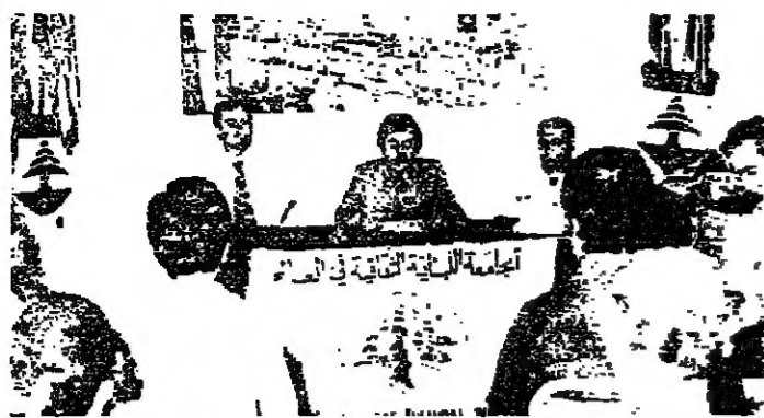
الامين العام المساعد للجامعة اللبنانية

هذه الدول بالذات - مثله في بلدان بسفارة فيما ينخل عليها بأربع من تقديراتها الثرية . يعني هذا أيضا ان توجه الدولة الى المغتربين يطالب او يشارع محددة ، تكون بمثابة الحرك لتقريبهم ومدى استنادهم للتجارب ، ويبنى الحكم على الفعاليات الاغترابية على ضوء هذا الاختيار ، ويحل هذا المقياس محل الاعتبارات العاطفية او الراحية والشخصية . لك في خلاصة الانطباعات التي عدت بها من جولتي ، وصيغة الامني والطالب والتطلعات التي عبر عنها أخواتنا المنتشرون ، التي ستكون محور اعمال مؤتمرها العالمي السادس الذي ينعقد اعتبارا من اول آب القادم . ولذلك هو الدور الجديد الذي سيلعبه من المؤتمري مناقشته وإقراره ، بعد تعديل دستور جامعتنا بحيث يتاح التصريح والبروح والإرادات الفعالة على خدمة أهداف الجامعة وإرضاء طموح الوطن الأم بإنائه لتقريب في كل أرض الرائعين لبنان اعلمه تحت كل سما . مسئلة واجوبة